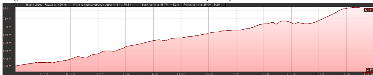
Graf: start: Vegrad – cilj: cerkva Sv. Primož

Proga B: dolžina 3,5 km; višinska razlika 444 m. Čas teka je omejen na eno uro.